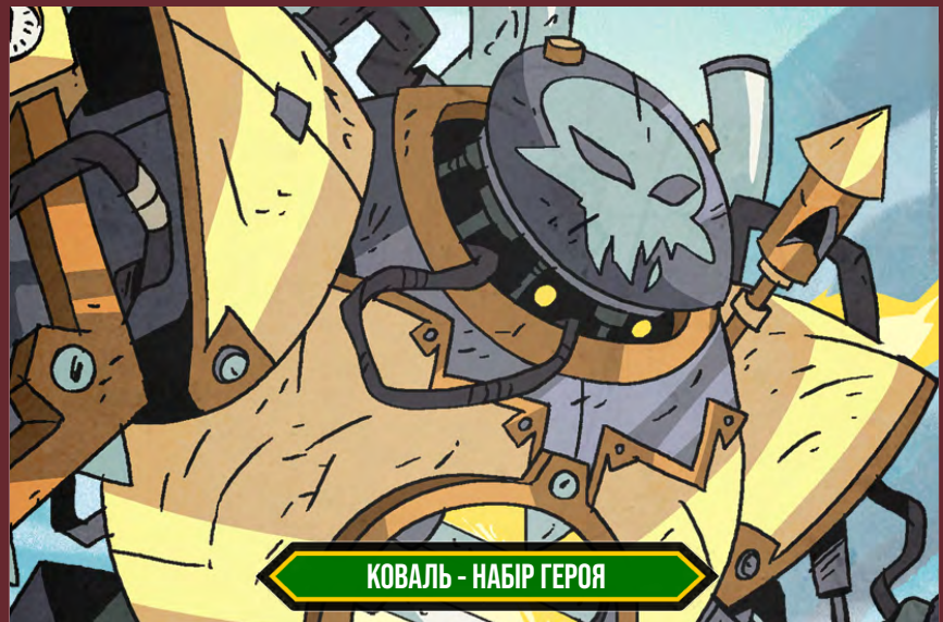
КОВАЛЬ - НАБІР ГЕРОЯ

Коваль — потужний робот, який має чудовий бойовий арсенал і готовий до будь-яких ситуацій. Мало хто може пробити його масивний щит, що подвоюється в розмірах і може зненацька вибухнути. Цей непереможний титан знає безліч способів знищення ворогів і йому ніколи не заважають емоції.