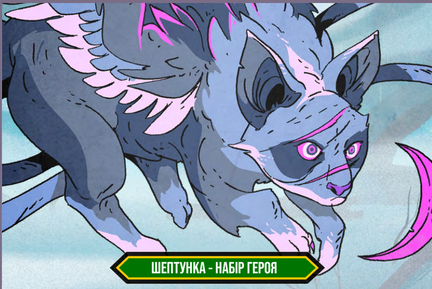
ШЕПТУНКА - НАБІР ГЕРОЯ

Перш ніж померти, Старий Вартовий створив Шептунку в серці Безлистоного лісу. За довгі роки боротьби з примарами вона розвинула свої вбивчі здібності. Шептунка здатна напасти так швидко, що жертва не встигне й оком змигнути.