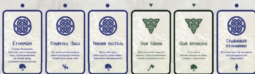
Карта ведущего, которая задала тему истории

2. Рассказчик берёт минуту на размышление, затем рассказывает историю, отвечая на поставленный вопрос. Он должен использовать 5 из 6 карт своей руки, выкладывая их по ходу рассказа в линию, начиная с карты вопроса.