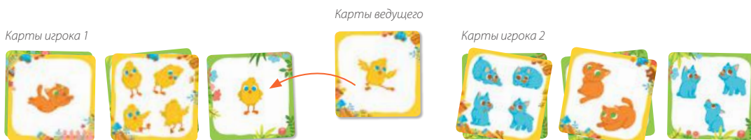
Рис. 4. Если ведущий открывает карточку, которая есть у игрока, игрок забирает эту карту и кладёт её поверх своей.

Выигрывает тот, кто первый соберёт все пары для своих карточек.