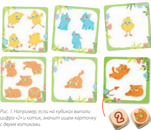
Рис. 1. Например, если на кубиках выпали цифра «2» и котик, значит ищем карточку с двумя котиками.

«Я в домике!» — командная игра, поэтому все участники считаются победителями, когда зверят удалось завести домой, и на поле не осталось ни одной карточки.