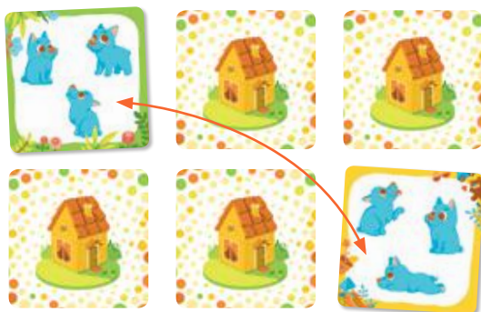
Рис. 3. Игроку в свой ход нужно открыть 2 одинаковые карточки: по количеству и типу зверят.

Игра заканчивается, когда карточек на столе не осталось. Побеждает игрок, набравший больше всех карт.